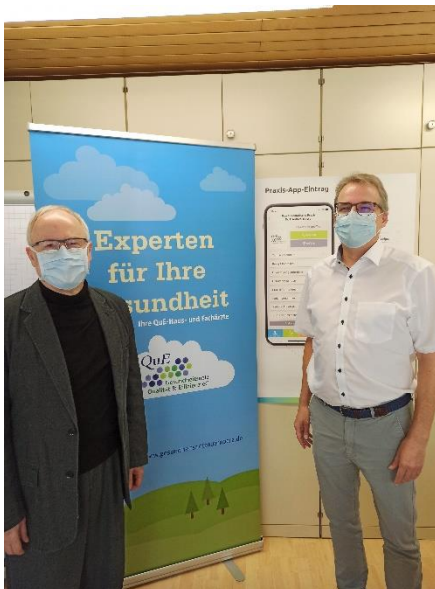
Gesundheitsnetz Qualität und Effizienz eG

Die Lizenz für das Motiv mit der Bildnummer „shutterstock_365445335“ wurde durch die Fa. mediQuu GmbH & Co KG bei shuttersock erworben.